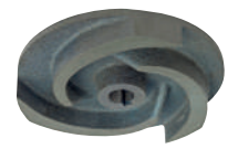
GIRANTE HCR HIGH CHROME IMPELLER